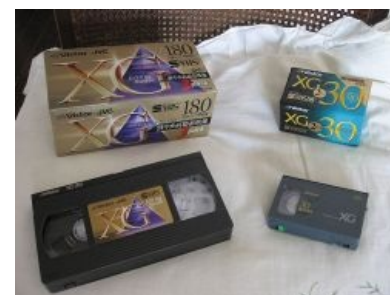
Кассеты VHS, S-VHS и S-VHS-C

Срач VHS vs. Betamax/Betacam — это типа как Blu-Ray vs. HD DVD, но Betamax был чутка получше. Есть мнение , что победа VHS над «Бетамаксом» была обеспечена выбором производителей прона — владельцы и распространители «Бетамакса» сделали ужасную ошибку, разругавшись с порнушниками. По другой версии, VHS-кассеты победили благодаря большей продолжительности записи на них.