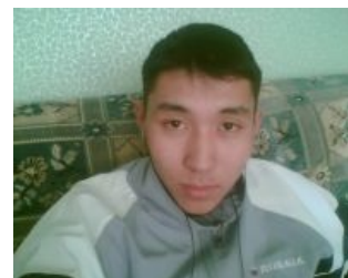
Vip-гастарбайтер смотрит на тебя, как на рулон гнилого рубероида.