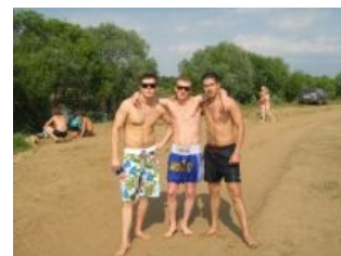
Сферические спортсмены на пляже.