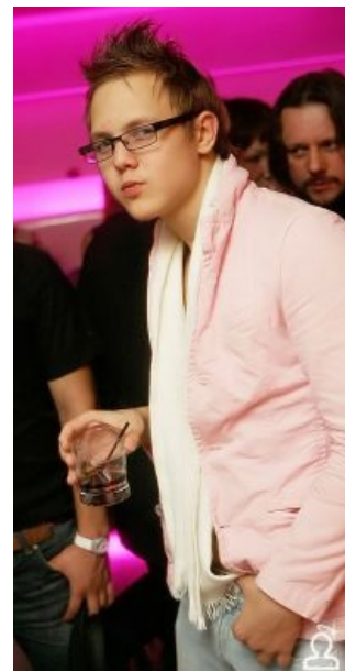
Школьник в роли VIP самца