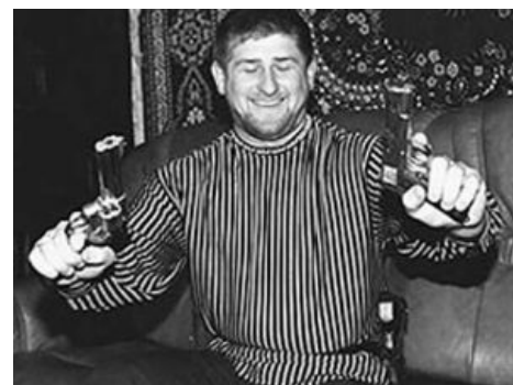
Самый главный VIP-самец с Кавказа и его сраный ковёр .