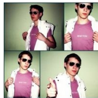
Разве не верится, что он V.I.P.?