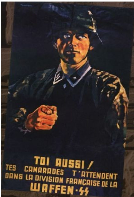
И французы тоже

Красной армией, и, вслед за этим, усиление влияния большевизма и коммунизма на умы граждан, вплоть до революции, коллективизации и прочих плюшек, а в-третьих Министерство пропаганды желало наглядных фактов всевропейского ополчения против Коминтерна (например: SS «Charlemagne» vs. «Нормандия-Неман»).