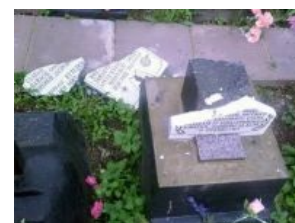
Осколки былинной казачьей славы

Доставляет, что при всём негативе по отношению к СС в этой стране, репутацию казаков-эсэсовцев периодически так пытаются отмыть. В 1997 году дело дошло аж до Верховного суда, однако ж, не получилось, не фартануло — казачьи лидеры на немецкой службе были признаны «обоснованно осуждёнными и не подлежащими реабилитации». Тем не менее, ещё в 1992 в их честь в самом ДС (sic!) был установлен мемориал, простоявший целых 15 лет, покуда не был выпилен неизвестным гражданином с активной гражданской позицией.