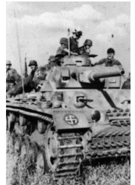
Танчик дивизии «Викинг»

С самого начала боевых действий в Европе немцы столкнулись не только с партизанским сопротивлением, но также и с поддержкой действий своих войск на захваченных территориях. Этому были три причины: во-первых, сепаратизм мелких государств и территорий, которые поддерживали Германию в обмен на обещание независимости, во-вторых — страх перед возможной оккупацией государства