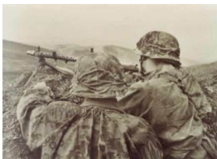
Waffen-SS в действии

Начиналось всё культурно: СС были созданы из 3,5 анонимусов как вооружённая охрана одного очень популярного австрийского живописца и настолько пришились ему по нраву, особенно после подавления бунта неверных штурмовиков ( не