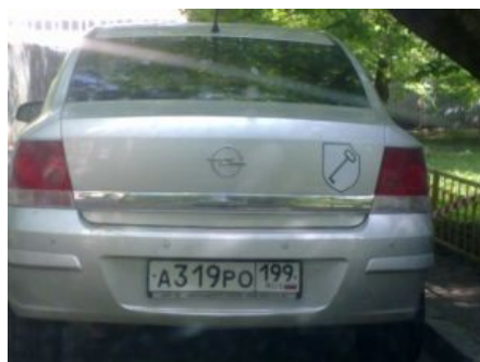
Лейбштандарт в Москве

Первая сформированная дивизия Waffen-SS, до того — личная охрана Гитлера. Одна из немногих дивизий, устроивших лютый баттхёрт и Красной армии, и войскам союзников, и мирным жителям. Естественно, что подразделение, несущее имя всеми любимого Фюрера, считалось элитой даже среди остальных в Войсках СС. Дивизия отличалась как успешным применением против войск противника, так и карательными операциями во всех странах, в которых побывала. Последней жертвой бойцов Лейбштандарта стал зять Евы Браун, которого казнили 29 апреля 1945 года по подозрению в измене. Алсо, дивизия «Лейбштандарт СС Адольф Гитлер» воюет в Ираке .