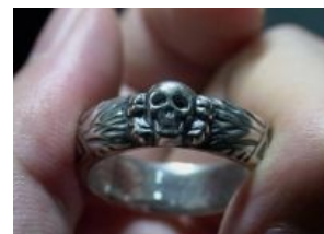
Nine for Mortal Men doomed to die...

Также череп и кости в обеих петлицах носили танкисты Вермахта, но у них они немного отличались. Вообще, эта символика ещё со времён Первой Мировой войны принадлежала Панцерваффе. В начале войны на Востоке, когда красные еще не разбирались в тонкостях, череп с костями, а также черная форма танкистов периодически наталкивали на мысль не морочиться с их взятием в плен.