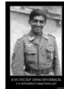
И даже азеры