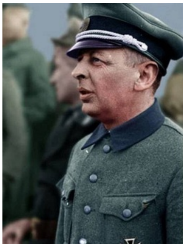
Каминский даже не смотрит на тебя

были подброшены немцам после серии неудачных покушений на него.