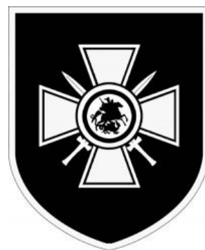
Георгиевский крест — эмблема РОНА. Ленточки негодуэ

Разумеется, главной идеей для них было скорее «домой, в рейх», нежели бандеровская «самостийность» — они таки австрийские славяне, а не хохлацкие унтерменши, Галиция цэ Европа . Обе команды спецолимпиады пытаются игнорировать это обстоятельство в попытках объединить их с бандеровцами: хохлы пытаются отмыть «Галицию», чтобы раздуть масштабы бандеровщины и отмазаться от участия в Холокосте и прочих нечеловеколюбивых деяниях, а москали радостно с ними соглашаются, пытаясь навесить на Бандеру чужие грехи и утопить его в коричневом . На выходе — лулзы и море еды, так как те и другие в равной степени путаются в показаниях.