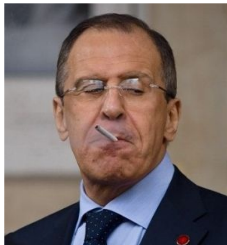
Как на говно.

Внимание! Это статья про нечто, имеющее отношение к политике. Она, вне всякого сомнения, заангажирована в чью-то пользу. Nobody cares.