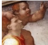
ВНЕЗАПНО Микеланджело, Сикстинская капелла