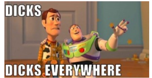
То самое макро