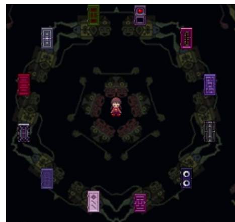
Вот тут мы и ходим в сны.

Собственно, мир снов — это именно тот самый ключ, который открыл игре дорогу к успеху. Сны, по которым нам предстоит путешествовать, зрелищны, широки и абсолютно бредовы. Мир поделен на 12 частей + комната перехода между ними, и все эти части имеют уникальное оформление и тематику. В неоновом мире все сверкает разными цветами, в темном мире не пройти без лампы, в снежном — идет снег ; но тут даже не в этом суть. Суть в том, что все эти миры буквально напичканы огромным количеством секретных комнат, лабиринтов и коридоров, которые зачастую вообще не похожи ни на то, что творится в других снах, ни даже на вообще что-то логичное. Зачастую какие-то комнаты ведут в другие сны, а какие-то заканчиваются тупиками. Все это битком набито разнообразными шизофазическими картинками, персонажами и объектами, а в качестве саундтрека почти везде используется тягучий и довольно-таки атмосферный дрон-эмбиент (послушать можно тут ).