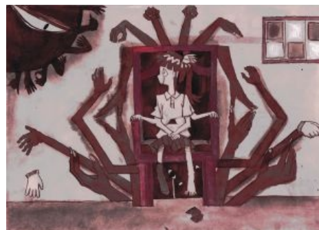
В игре очень много рук. И глаз.

Живут они в белой пустыне. Чтобы попасть к Моноко , нужно спуститься вниз к бесконечной дороге и зайти в тоннель. Там будет ждать сабж, представляющий из себя просто монохромную лоли , но стоит только применить рядом с ней эффект светофора... Еще раз можно убедиться, что Мадоцуки видела автокатастрофу, или вообще в нее попала. Моноэ водится неподалеку и представляет собой такую же монохромную лолли, которая при попытке взаимодействовать даже улыбнется на весь экран, но вот выцепить ее трудновато, ибо она ходит в большой черной комнате. Эти две тья, в особенности Моноко, породили много фанарта в гротескном или юрийном стиле.