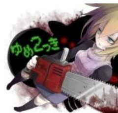
Уроцуки с бензопилой