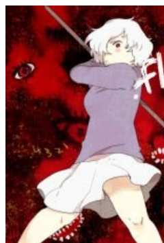
Сабицуки с брутальной трубой

Причаститься — [3], Скачать — [4] Внимание! Заинтересовавшемуся игрой анонимусу будет также интересна версия 0.16 ака «Первоапрельская». Содержит всего один ивент, но стоит того безусловно. [5]