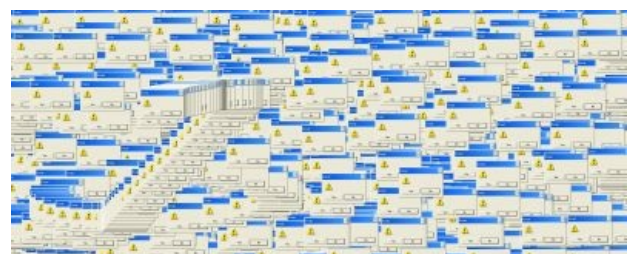
Один баг. Но какой!