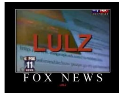
Лулз на американском телеканале FOX LA

Последствия злоупотребления поклонением сабжу: