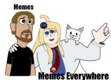
Мемы, мемы повсюду