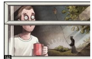
Безудержное летнее веселье.