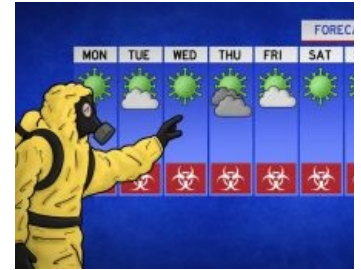
Прогноз погоды: коронавирус.

Вирус из Мексики. На момент написания статьи там и в США от вируса уже трагически склеило лапы Нное количество человек.