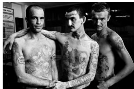
Суровая мужская дружба

Вор ака Положенец. Попадают в тюрьму осознанно, и потому рулит жизнью "курорта". Для них тюрьма — лишь закономерный этап жизненного пути, и они к нему готовы, в отличие от тех, кто вчера сидел дома и жрал щи , а сегодня вдруг оказался на нарах в Мухосранске . В одном лагере их может быть сколько угодно, но Положенец всегда ТОЛЬКО один. Коронует, назначает и снимает «смотрящих», разбирает споры, когда смотрящий бессилён и т. д. Обычно, как значится в документах тюремной администрации, «содержится отдельно от остальных заключённых». Но если вы думаете, что он сидит в глухой камере-одиночке, как какой-нибудь особо опасный маньяк, вы глубоко ошибаетесь. У него там такие апартаменты, каковых у некоторых людей и на воле нет. Понятно, что пойлом, продуктами и мобильниками его снабжают без ограничений. Также ВОР часто расшифровывают как «внештатный оперативный работник», выводы делайте сами.