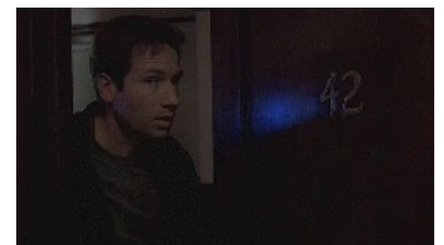
Малдер кагбэ отрицает свою причастность к 42

В сериале и в книгах X-files 42 встречается довольно часто. Так, в эпизоде 6x05 ( Dreamland 2 — Страна грёз 2 ) можно невозбранно удостовериться, что Федеральный агент Малдер проживает в квартире № 42, это также описано в рассказе «Эпицентр». Работает он в кабинете № 42, что описано в файле 302 ( Операция «Скрепка» ) книжной, и в эпизоде 3x01 ( The Blessing Way — Благословенный путь ) телевизионной версий событий. Несколько раз в гостиницах он оказывается также в номере 42. Также в эпизоде 7x19 ( Hollywood A.D. — Голливуд, наша эра ) Малдер говорит, что смотрел фильм « План 9 из открытого космоса » 42 раза.