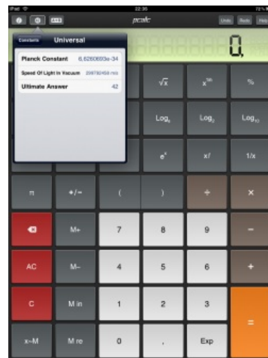
Ultimate answer constant